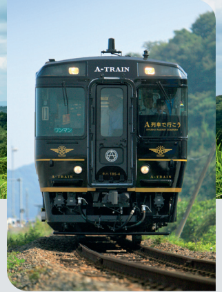
※写真はすべてイメージです