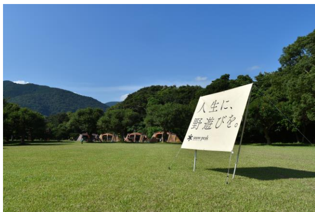
キャンプサイト イメージ